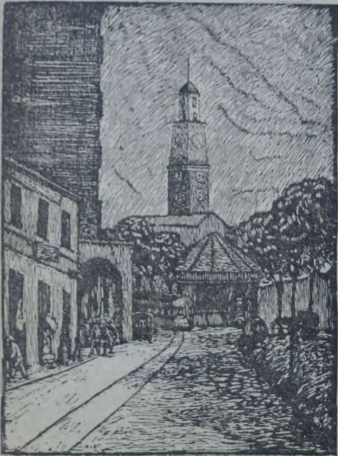
PASEO DE JULIO (PREMIO SALON. NACIONAL)