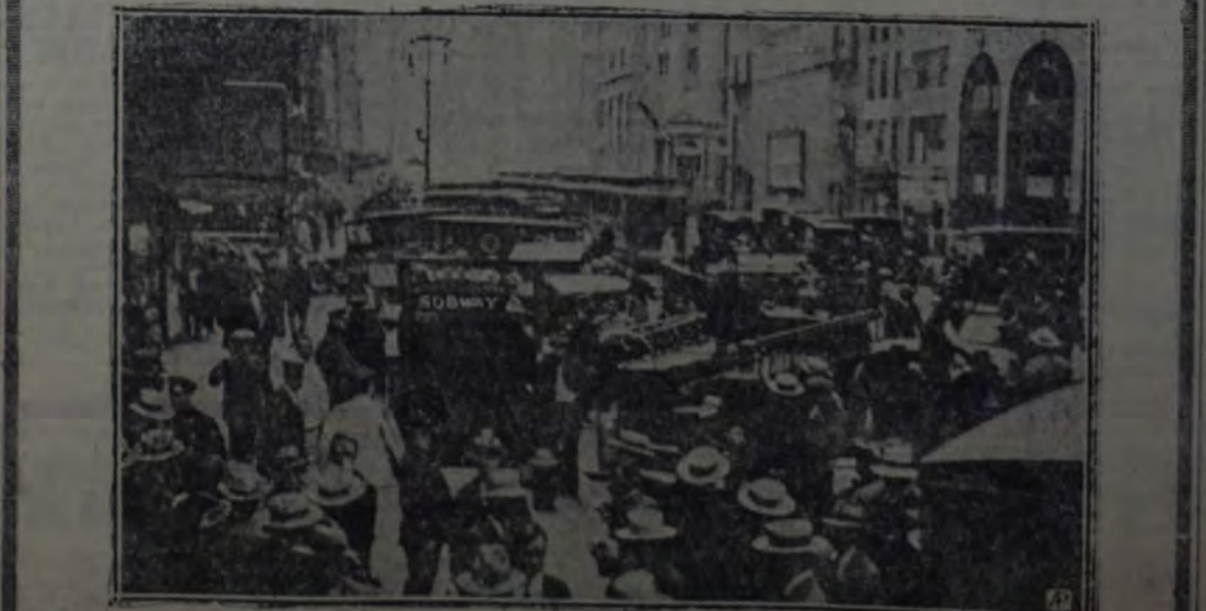
FOTOGRAFIA TOMADA EN LOS MOMENTOS EN QUE BOMBEROS Y POLICIAS SE OCUPABAN EN SUBIR A LOS MUERTOS Y HERIDOS EN LA CATÁSTROFE DEL FERROCARRIL SUBTERRÁNEO, EN LA ESTACION DE TIMES SQUARE. Millares de personas se agruparon en torno a la entrada de la estación y en la función a besarse en la tragedia. Times Square está enclavada en el corazón de la ciudad de Nueva York, y de no haber logrado mantener el orden los agentes de la policía, el desastre hubiera tenido proporciones horribles.