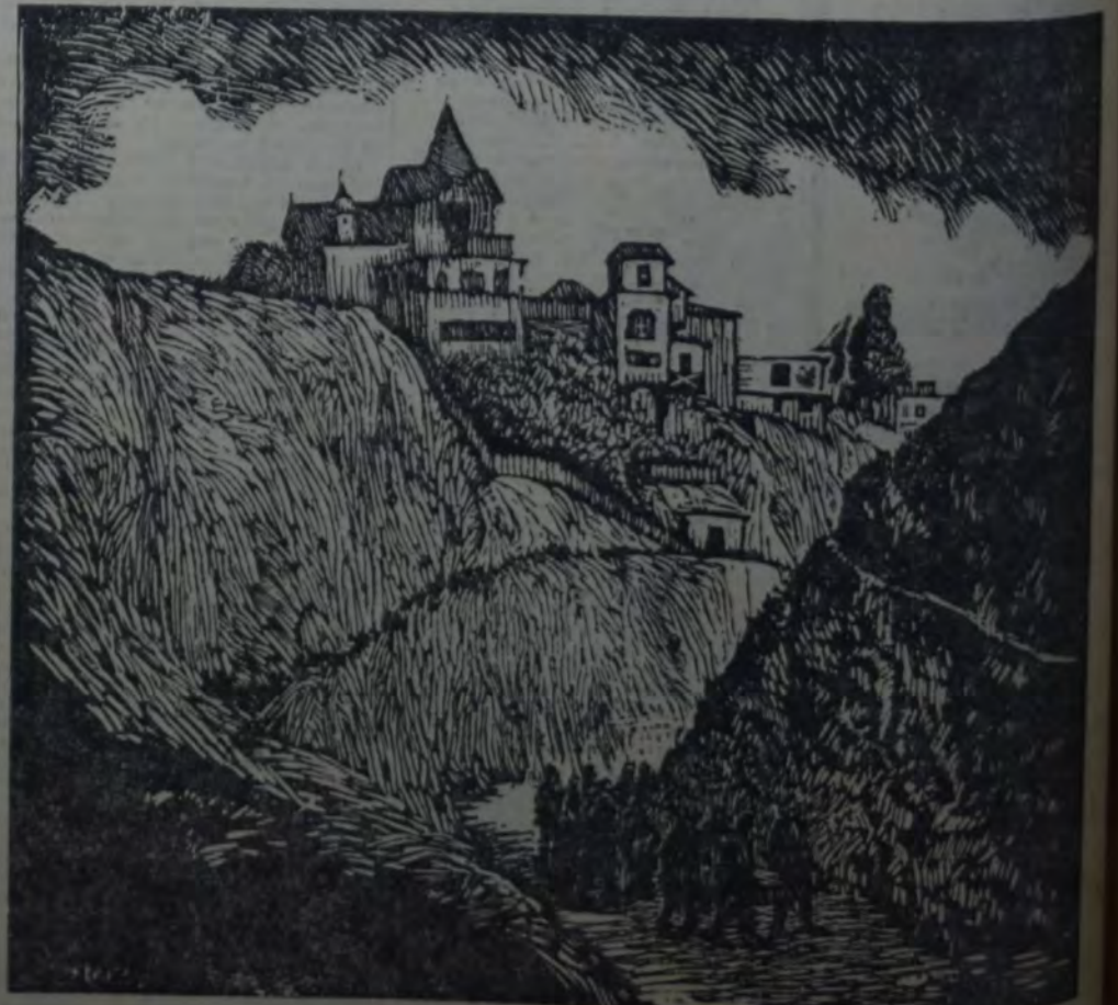
PAISAJE DE CHILE