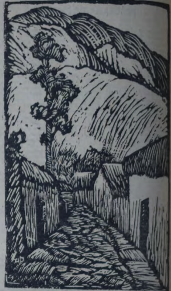
CALLE DE PUEBLO (BOLIVIA)