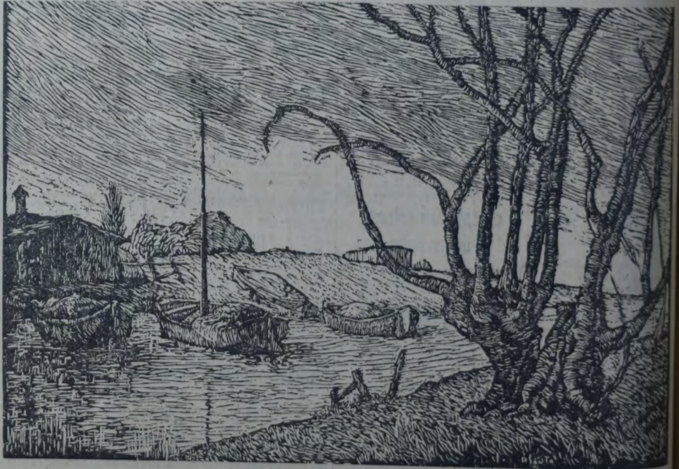
"CAMBACERES" (PUERTO LA PLATA)