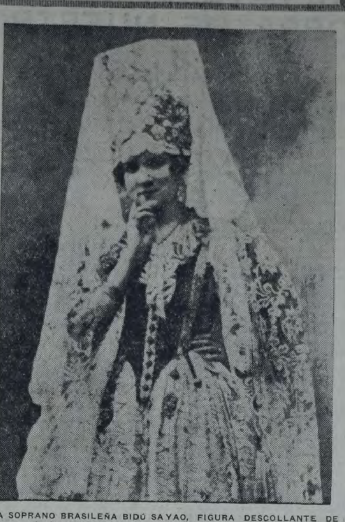
LA SOPRANO BRASILEÑA BIDÚ SAYAO, FIGURA DESCOLLANTE DE LA BREVE TEMPORADA LÍRICA QUE SE REALIZA EN EL COLÓN.